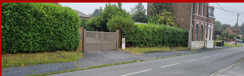
Rue Alphonse Dussart