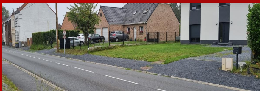
Rue Alphonse Dussart