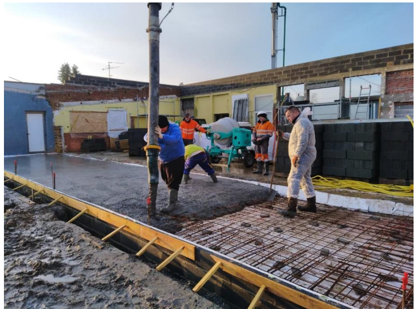
Extension de la dalle de la salle