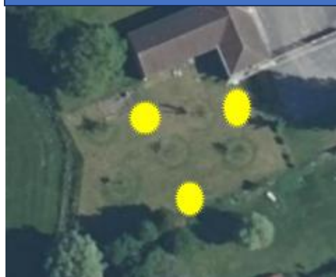
ILLUSTRATION PLANTATION MDA