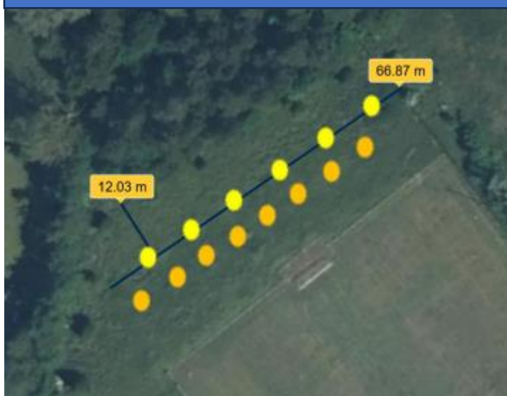
ILLUSTRATION PLANTATION STADE