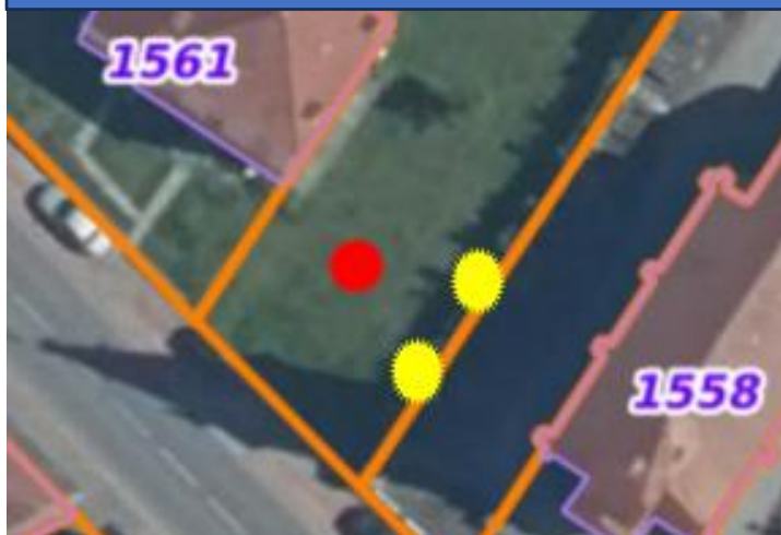
ILLUSTRATION PLANTATION PRESBYTERE