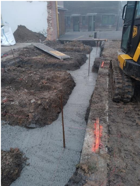
Coulée des semelles au petit matin