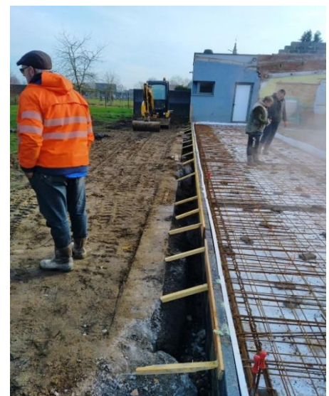
Élévation des murs de ceinture