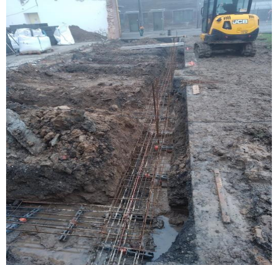
Ferrailage de la nouvelle dalle